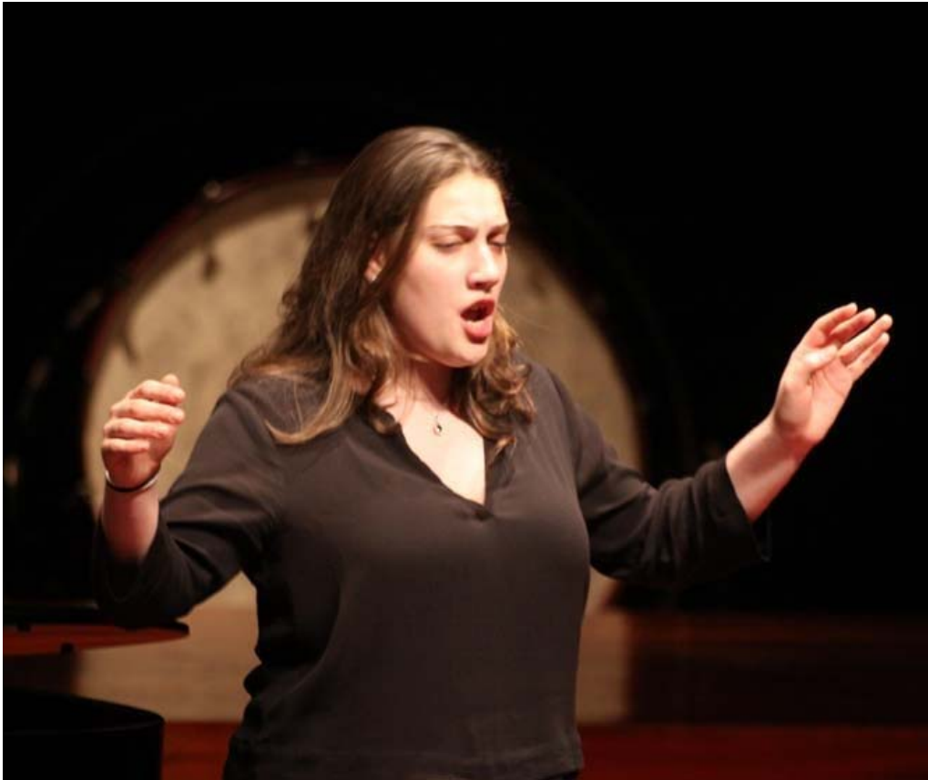
Una de las actuaciones en la Mostra d.a.

redacción vilagarcía | 25 de Abril de 2016