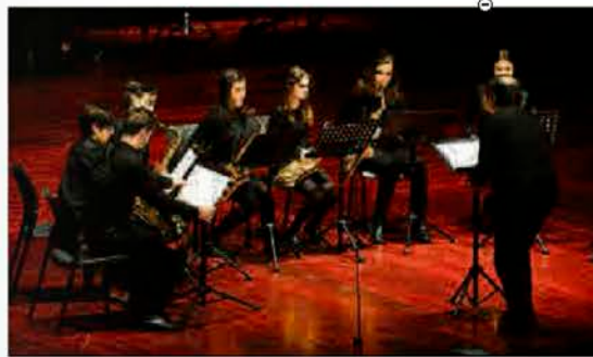
Uno de los grupos que disputaron la final.

Posteriormente se procedió a la entrega de premios a los intérpretes ganadores.