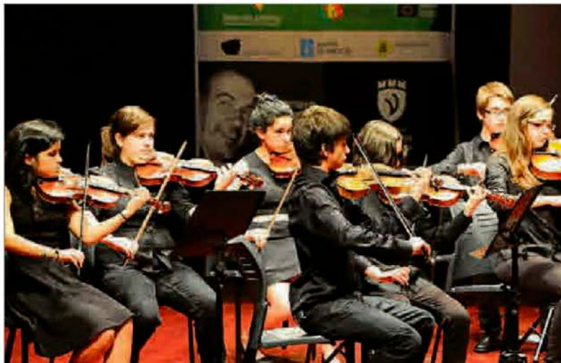
Un grupo de jóvenes intérpretes en una de las ediciones de la Mostra do Eixo Atlántico.

El Eixo Atlántico, añadió Varela, es el organismo que permite al Ayuntamiento, como organizador