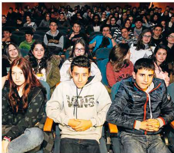
Más de un centenar de estudiantes de 3º y 4º de ESO se dieron cita en el Pazo Emilia Pardo Bazán para disfrutar de la sesión didáctica de Paskual. DAFA FARINA