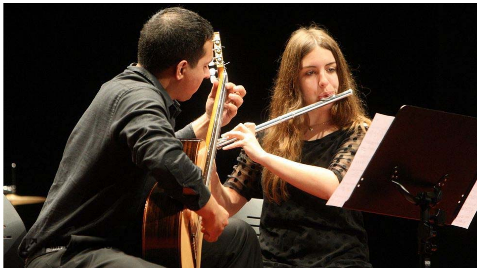
MARTINA MISER (HTTP://WWW.LAVOZDEGALICIA.ES/FIRMAS/MARTINA-MISER).

BEA COSTA (HTTP://WWW.LAVOZDEGALICIA.ES/FIRMAS/BEATRIZ-COSTA-VAZQUEZ). 13 de abril de 2016. Actualizado a las 05:00 h. ★ ★ ★ ★ ★