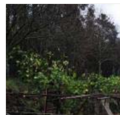
Una de las plantaciones pa...