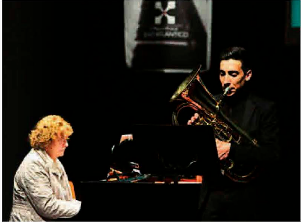
Uno de los participantes en una anterior edición de la Mostra do Eixo en Vilagarcía.

En la fase de inscripciones las categorías más demandadas han sido la A y la B de solistas, según re-