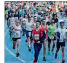
Participantes en la prueba. // Abella

El documento, que se somete a pleno, plantea erradicar el maltrato Pág. 3