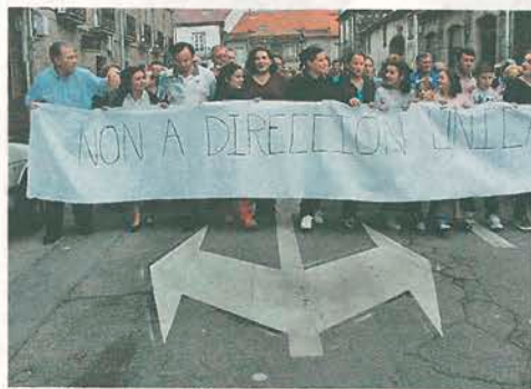
Una de las protestas lideradas por los comerciantes. V. M.

la medida acabó aplicándose y hoy la calle San Lois es de dirección única. Gobernaba entonces un tripartito liderado por el nacionalista Luis Álvarez Angueira, y el Partido Popular enseguida se desmarcó de aquel reglamento de tráfico urbano que se aprobó seis meses antes. El gobierno local defendía la dirección única como la mejor solución para evitar atascos y ganar aparcamientos mientras que el PP y los comerciantes detractores argumentaban que iba a ser perjudicial para los negocios.