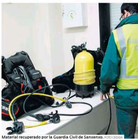
Material recuperado por la Guardia Civil de Sanxenxo.

Las diligencias serán entregadas al Juzgado de Cambados.