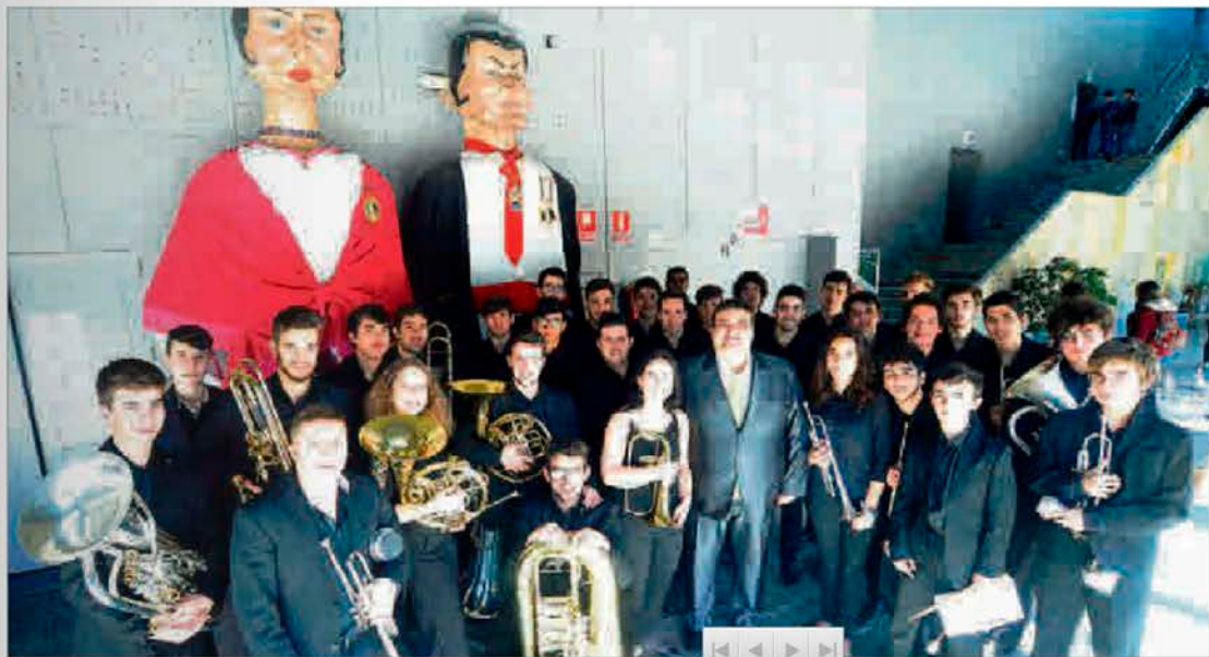
Un grupo de músicos portugueses esperan el turno para comenzar su actuación en el Auditorio.