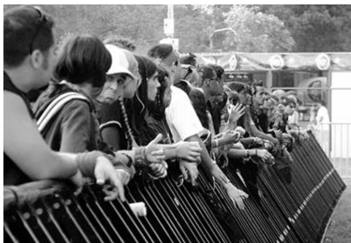
Caminha aprova protocolo que garante Festival de Vilar de Mouros

Em 2007, a um mês da sua realização, o Festival de Vilar de Mouros foi cancelado por dificuldades de entendimento entre os vários parceiros envolvidos na organização e foi retomado em 2014, a cargo da Associação dos Amigos dos Autistas. No final dessa edição, que marcou o relançamento do evento após um interregno de oito anos, a AMA anunciou o regresso, em 2015, nos dias 30, 31 de Julho e 1 de Agosto.