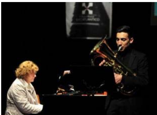
Uno de los participantes en una anterior edición de la Mostra do Eixo en Vilagarcía.

Vilagarcía de Arousa, como promotora de este certamen, mantiene el Auditorio Municipal como sede para la celebración de la fase final.