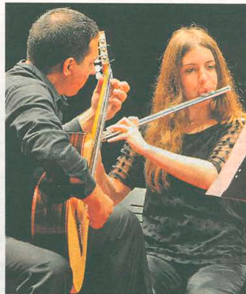
Intérpretes de la Mostra, en una edición anterior. M. IRAGO

La muestra se dedica cada año a un compositor en activo, a modo de reconocimiento público y para divulgar su obra. En esta ocasión, el elegido es Eurico Carrapatoso,