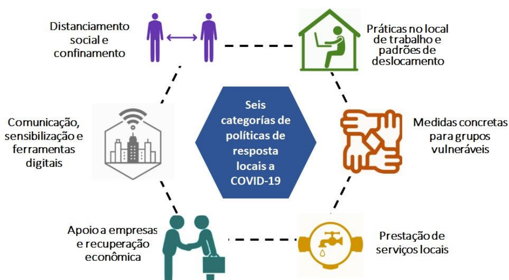
Figura 1. Seis categorias de políticas de resposta a COVID-19

Das políticas de resposta identificadas, algumas observações podem ser feitas em termos de resiliência urbana e a capacidade de se recuperar do choque: