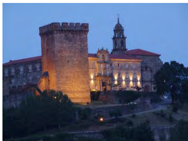
Património e história