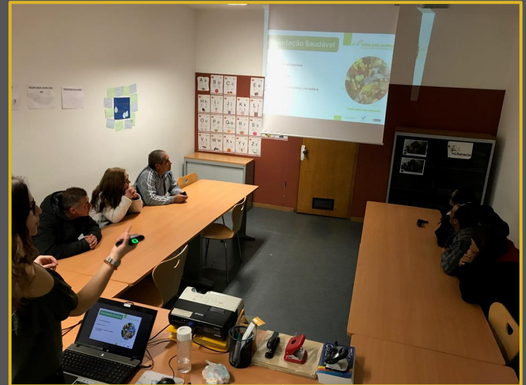
CIAC – Centro Informação Autárquico do Consumidor