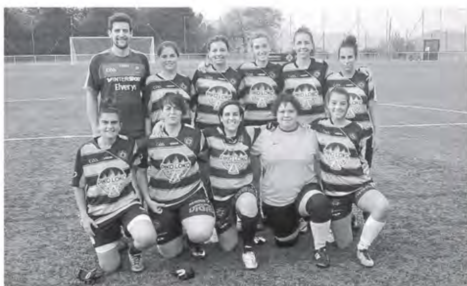
El equipo femenino del Auriense FG ganó en Pontevedra.

Por su parte, el equipo femenino del Auriense Fútbol Gaélico mantiene su racha positiva después de imponerse a un rival directo esta temporada, el Pontevedra FG por un tanteo de 18-26. El acierto cara el marco rival fue definitivo.