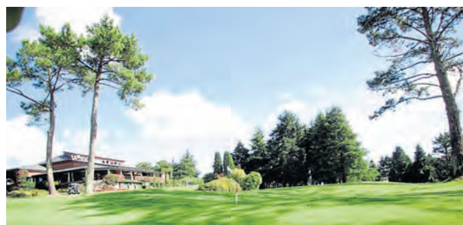
Todo está preparado en el club herculino para acoger una de las grandes citas del otoño | PATRICIA G. FRAGA