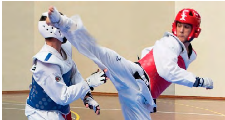
Imaxe do cartel do torneo de taekwondo.

A cita reunirá a máis dun cento de deportistas, a vindeira fin de semana en Gaia (Portugal)