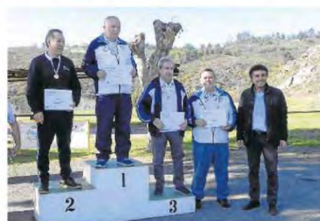
El podio en la categoría de veteranos.