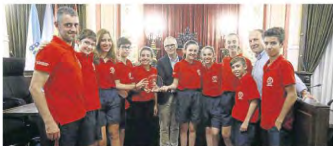
Jesús Vázquez, alcalde de Ourense, en la recepción a la expedición ourensana al Torneo Eixo Atlántico.

comenzó con la recepción en el Concello de Ourense por parte del alcalde Jesús Vázquez a los deportistas que acudieron al Torneo del Eixo Atlántico.