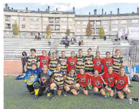
El Auriense femenino, en una cita de la Liga gallega.

Después del parón por el Torneo Internacional de Maastrich el Auriense regresó a las competiciones autonómicas con un doble enfrentamiento en Santiago ante el Estrela Vermella. Los chicos cayeron por un ajustado 27-27, y las chicas cedieron por 31-7.