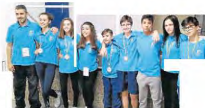
El Centro Deportivo Couto en el Open de Pontevedra.