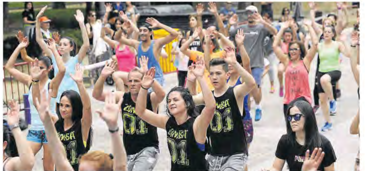
Un grupo de asistentes a una de las jornadas de fitness con +Deporte y Le Región.