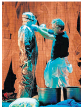
Imagen de la obra

La obra, con la catástrofe del Prestige como eje, tendrá lugar a las 20.00 horas en el Pazo da Cultura