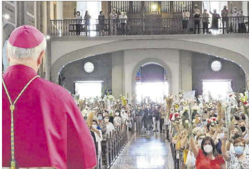
El obispo, de espaldas, durante la misa en la ofrenda floral de las madres. // Fernando Casanova

hubo más participación en la novena, pues, aunque en todo momento recomendamos llevar mascarilla, no podemos obligar a los fieles, no era necesario numerar asientos y separar a los fieles como estos años”, indica el copárroco.