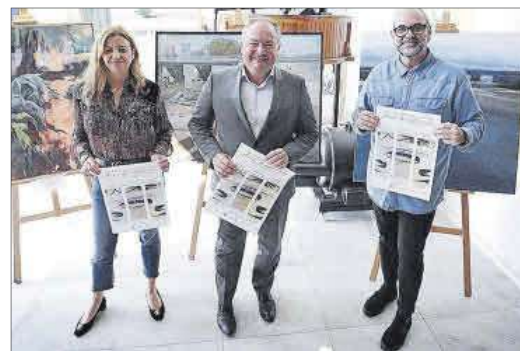
Presentación, ayer, de la Feira de Artesanía.

En el operativo intervinieron la Policía Local y el Servicio Municipal de Emergencias y Protección Civil de Cambre.