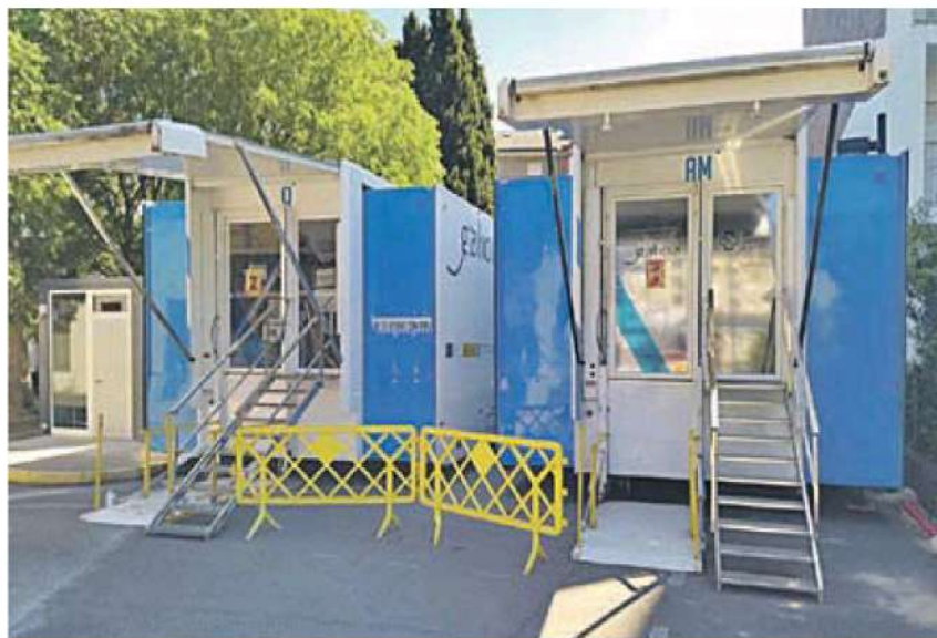
Hospitales móviles instalados provisionalmente en O Barco.

Después de varios meses de trabajos, encaminados a liberar las áreas a reformar, el traslado permite reiniciar la obra del área de Hospital de Día y de las secciones de Farmacia y Cirugía Mayor Ambulatoria. Estas actuaciones, que supondrán una inversión de 1.287.909 euros para la Xunta de Galicia, fueron adjudicadas a Construcciones Jesús Naray S. L., según el proyecto de Herrerías Arquitectura, que asumió la direc-