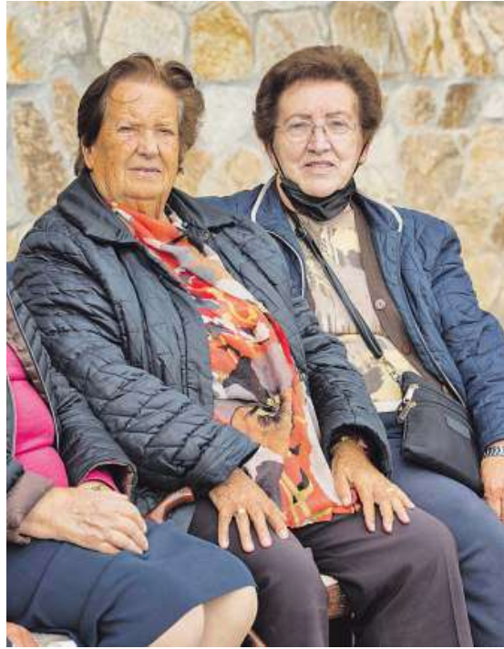
Dos mujeres jubiladas, ayer, en Carballo. ANA GARCÍA

En la comarca hay notables diferencias, más allá del caso corcubionés, que es además el municipio con mayores pensiones de media, 988 euros. La más baja en las mujeres es al de Cabana, con 642 euros. La mayoría de concellos se quedan por debajo de los 700 euros para ellas: Zas, Vimianzo, Camariñas, Cerceda, Muxía, Malpica, Laxe, Carballo, Coristanco y Carballo, además de Cabana. En hombres, ninguno. De hecho, lo raro es bajar de