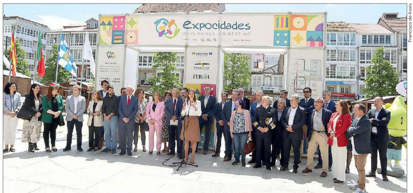
O adjunto do presidente da Câmara de Braga deu conta da atividade cultural a decorrer em Braga nos próximos meses