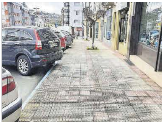
Tramo donde se ubicará la nueva parada, ahora situada al fondo.

El lugar donde ahora mismo se ubica la parada, a la altura del portal 17, se convertirá en una zona de carga y descarga.