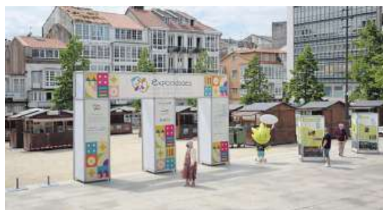
Una treintena de casetas forman la feria instalada en Armas.

en la que se promoverá el turismo de proximidad entre las localidades gallegas y lusas y las diputaciones que forman parte del Eixo Atlántico. Los visitantes podrán degustar, entre muchos otros productos, chocolates de Vila Nova de Gaia, rabanadas poveiras de Póvoa de Varzim, galletas y vinos verdes de Viana de Castelo, embutidos, jamón de porco celta y pan de Sarria, o participar en catas de vinos de Valdeorras —actividad para la que será preciso inscribirse en la caseta de O Barco—