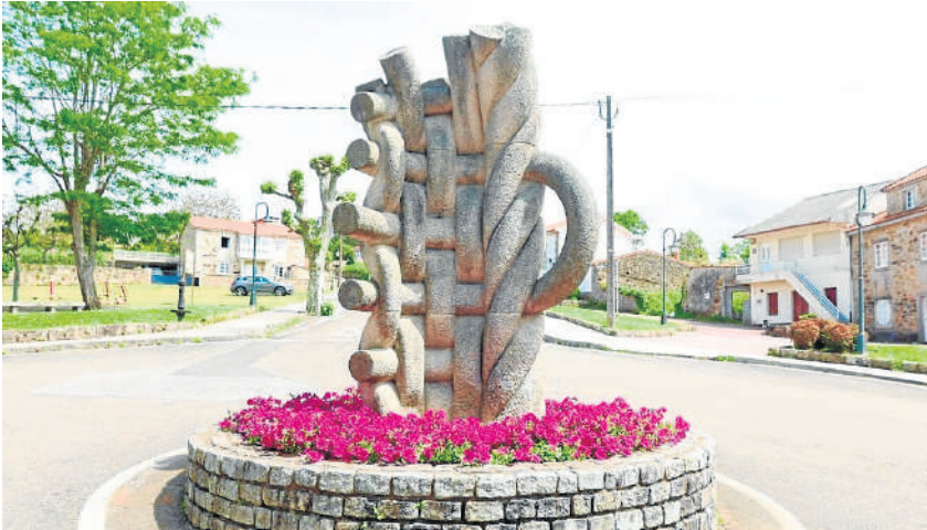
Espacio ajardinado del concello de Ponteceso