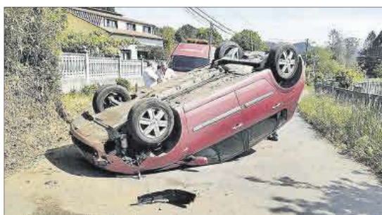
Vehículo volcado en Meixigo. // L.O.

El Gobierno local ya sacó a licitación la organización de este evento por 34.624 euros, dividida en dos lotes: uno para los conciertos en directo de los cuatro grupos y su coordinación y comunicación; y otro para el suministro de equipos y personal necesario. El Concello ya organizó en 2021 el Ciclo Noites de Jazz como "preámbulo" a este festival.