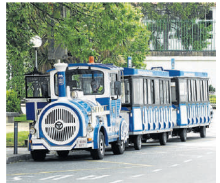
Degustaciones, demostraciones gastronómicas, showcooking, promoción de la ciudad y viajes turísticos se desarrollaron durante toda la jornada