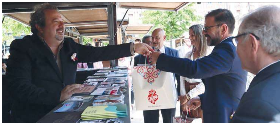
Viana do Castelo aposta no turismo de proximidade com as pessoas e com a natureza

Trata-se, no fundo, de uma festa da gastronomia e do turismo, onde as diferenças enriquecem o produto turístico como um todo.