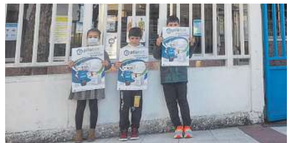
Alumnos del colegio Santiago Apóstol con el cartel del certamen.

El colegio Santiago Apóstol de Narón se estrenó este año en el concurso Pilabot, convocado por la Consellería de Medio Ambiente para favorecer el reciclaje de pilas, y consiguió el primer puesto en términos absolutos, al recoger 4.749,70 kilos de pilas en sus instalaciones. Por su parte, el ganador de la categoría de centros con las mejores ratios de recogida por alumno fue el CRA Amencer, de Ribadavia, con 62,80 kilos por estudiante. Otro centro de Narón, el CEIP de Piñeiros, acabó tercero en la modalidad