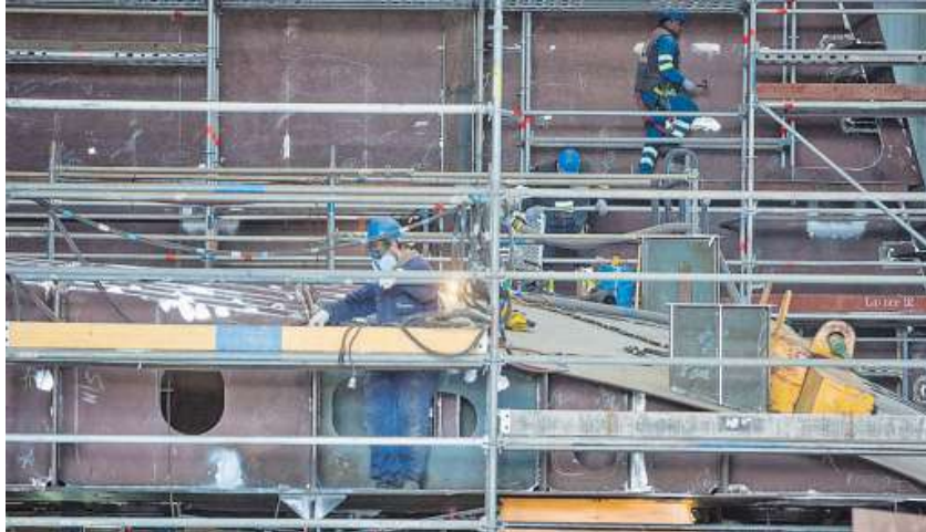
Los talleres de Navantia —en foto de archivo— volverán a tener actividad.

A falta de publicarse los listados definitivos —los interesados pueden presentar sus reclamaciones hasta las 23.59 horas del jueves, día 28—, los puestos de administrativo serán los más competidos, ya que hay 128 aptos