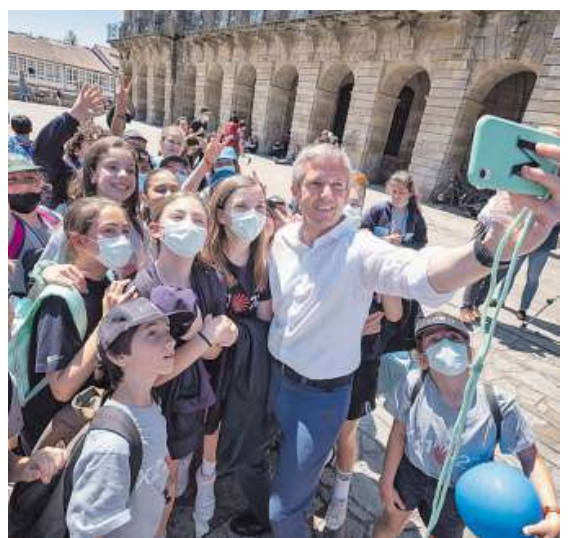
Rueda en la plaza del Obradoiro con los alumnos de Cristo Rey.

A pesar de que la agenda del nuevo presidente de la Xunta es intensa, Rueda no faltó a la promesa que realizó el pasado mes de febrero en Ferrol de que recibiría a los alumnos de Cristo Rey en la plaza del Obradoiro cuando completaran el Camino por eta-