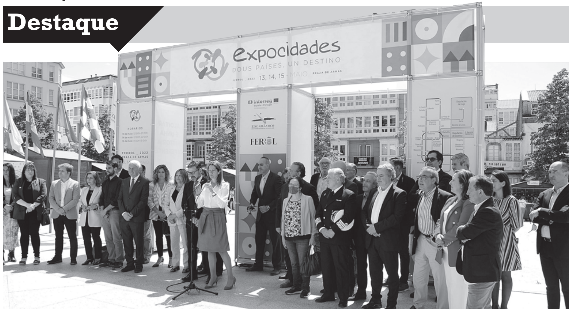
A 6.ª edição do Exposcidades arrancou pelas 13 horas de ontem na cidade de Ferrol, contando com a representação de quatro municípios minhotos: Braga, Viana do Castelo, Barcelos e Vizela