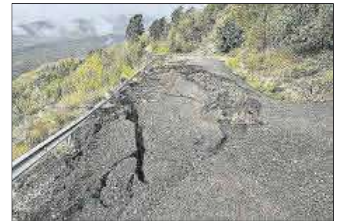
La carretera de San Vicente.

Segundo, se repartirá el proyecto en varias fases debido a su cos-