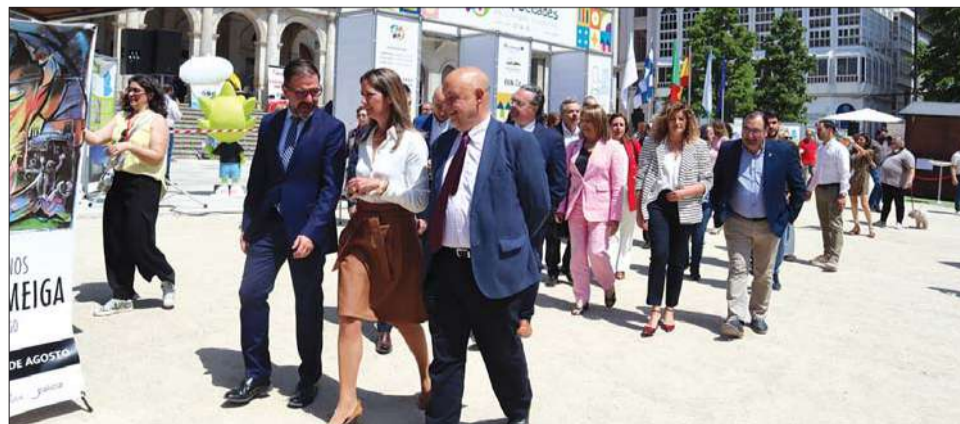
A feira é uma forma de mostrar semelhanças e diferenças que enriquecem a região