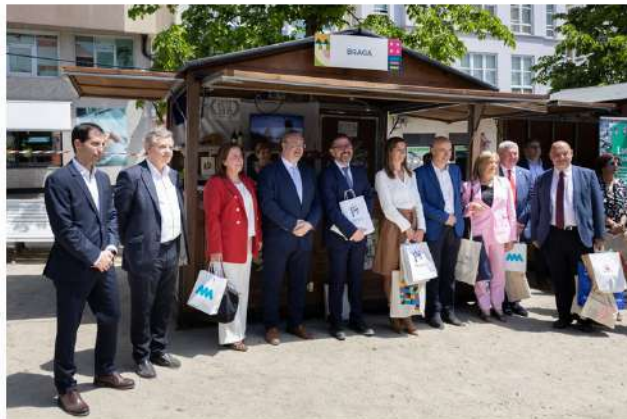
Braga marcou presença na 6.ª edição da ExpoCidades – Mostra de Turismo das Cidades do Eixo Atlântico, que