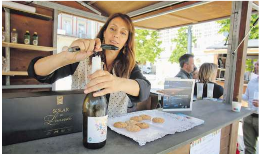
Una de las casetas en las que ayer se convidaba a viño verde y dulces portugueses.

Este último trabajo ha sido grabado y mezclado en RRstudios y Masterizado en los estudios Kadifornia. El recital comienza a las 24 horas.