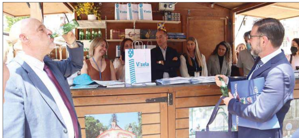
Vizela mostra-se sobretudo através das termas e do bolinho, doce por excelência do concelho