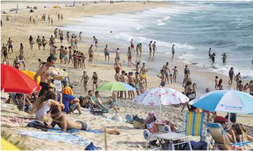
La playa de Doniños, ayer, llena de visitantes, al igual que el resto de arenas de la zona. JOSÉ PARDO