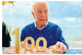
Ayer, durante la celebración

Este polifacético madrileño de nacimientos celebró ayer sus 100 años de vida, rodeado de su familia -cinco hijos, nietos y biznietos- y pese a las muchas situaciones a las que ha tenido que hacer frente en un siglo, no pudo contener las lágrimas de emoción al verse tan arropado por sus descendientes.