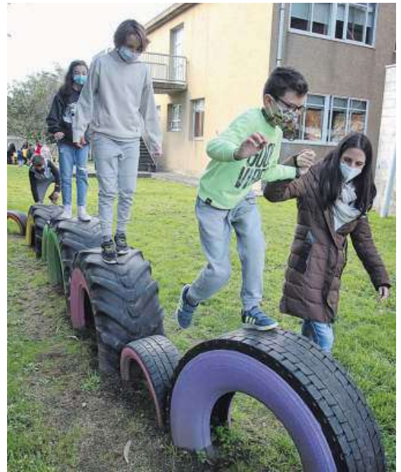
Alumnos de A Laxe jugando en un circuito en el exterior.