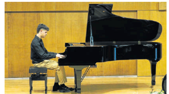
Actuación de un pianista santiagués en el Xan Viaño | JORGE MEIS

La primera ruta ciclista en familia que se celebró ayer en Neda congregó a un centenar de personas de todas las edades.