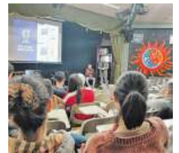
Charla en el instituto Eduardo Pondal de Ponteceoso.

El Concello de Carballo participa, una vez más, en la Mostra Turística das Cidades do Eixo Atlántico, Expocidades, que este año se celebra en Ferrol, desde hoy viernes y hasta el domingo. La cita sirve, desde su nacimiento, para promocionar el turismo de proximidad, estableciendo contactos con productores turísticos y comercializadores. La gastronomía ocupa un papel importante, y habrá pan y empanadas de Carballo, además de todo el material divulgativo habitual del municipio.