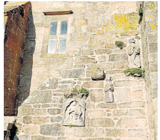
Laxe, una de las paradas de la Vía Céltica | VÍACÉLTICA

La Casa da Cultura de A Picota, en Mazaricos, acogerá esta tarde a partir de las 17 horas las jornadas de Turismo organizadas por el Concello. Está prevista la celebración de la mesa redonda "Mazaricos, pasado e futuro entre a costa e interior", con la participación del vicepresidente provincial, Xosé Regueira; Carmen Pita, de Turismo de Galicia; Alexandra Seara, del Consorcio de Ribeira Sacra y el alcalde.