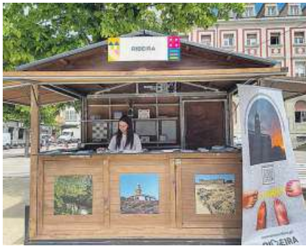
Caseta con la que Ribeira se suma a Expocidades.