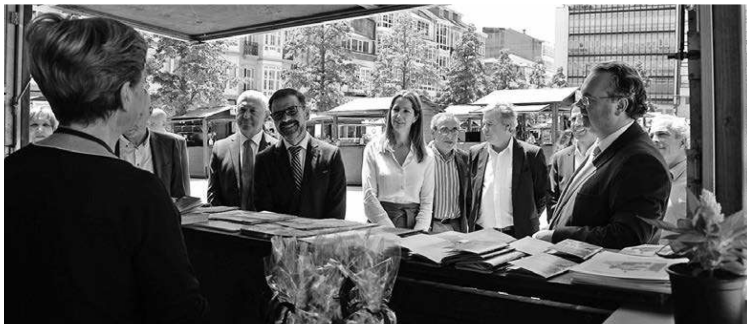
Durante a visita ao stand de Braga, convidados foram presenteados com fidalguinhos

António Barroso notou ainda que a promoção do turismo em