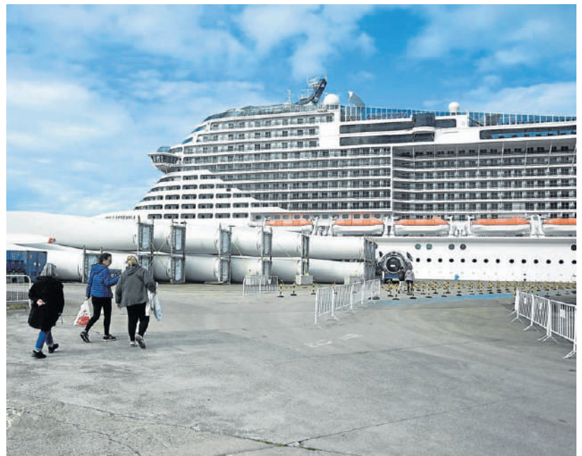
Un grupo de pasajeros retorna al crucero "MSC Virtuosa" después de pasar la mañana en la ciudad | EMILIO CORTIZAS

de mayo. Por su parte, el alcalde de Ferrol señaló la importancia que tiene para este municipio el acoger entre los días 13 y 15 de mayo "dos importantes eventos". En cuanto a la propuesta musical Mato detalló que "se trata de promover, premiar y difundir la práctica y afición a la música entre adolescentes tanto en Galicia como en el norte de Portugal".