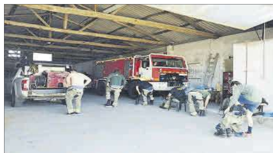
Los trabajadores no tienen zona para vestirse.

Junto a la nave, en anexos, hay unos módulos con aseos y vestuarios en mal estado en los que hay taquillas junto a los váteres debido a la falta de espacio. Los desagües no