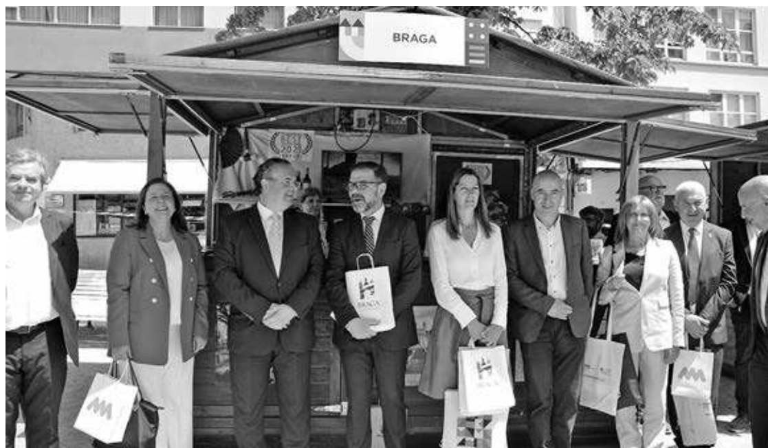
Inauguração da cerimónia ficou entregue à presidente do Eixo Atlântico, Lara Mendéz, alcaldesa de Lugo

Braga, Viana do Castelo e Barcelos são os três municípios minhotos com stands nesta 6.ª edição, dedicados à promoção do sector turístico nos seus respectivos concelhos, procurando assim enaltecer os pontos fortes de