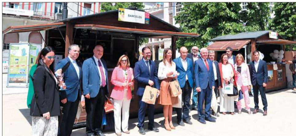
Barcelos promove a gastronomia, sobretudo o galo, frito e como símbolo do concelho e do País