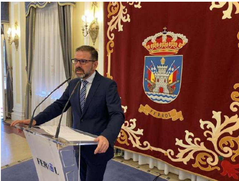
O alcalde de Ferrol, Ángel Mato

"En Ferrol aproveitaremos este excelente escaparate para promover especialmente os nosos recursos turísticos, como o Camiño Inglés ou o Ferrol Ilustrado, entre outros" , concluíu Mato.