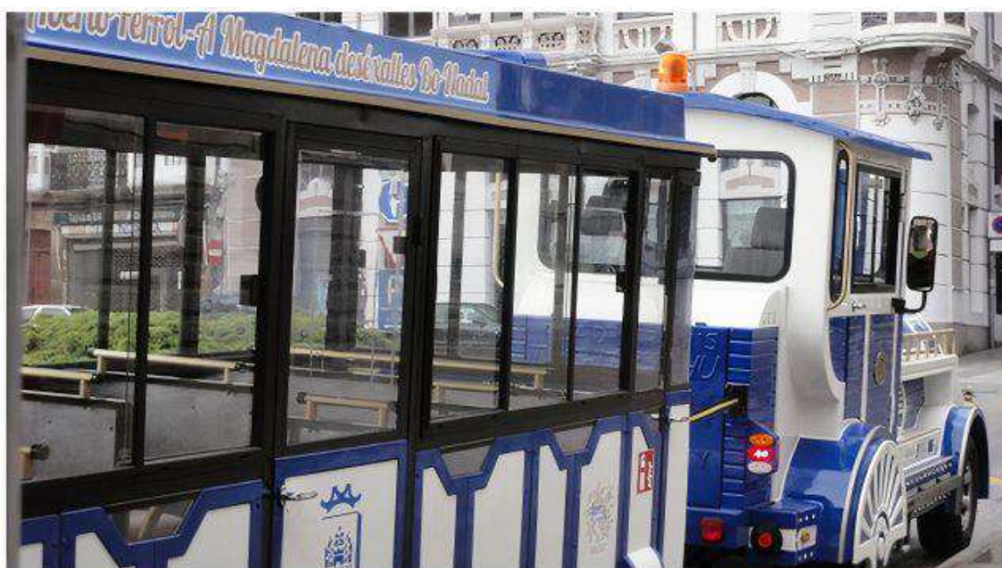
Imagen de archivo del tren.