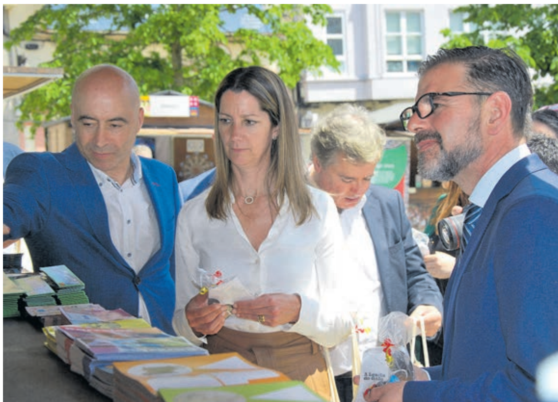
Presidente do Eixo Atlântico e alcaide de Ferrol foram presenteados com figuras do Galo de Barcelos