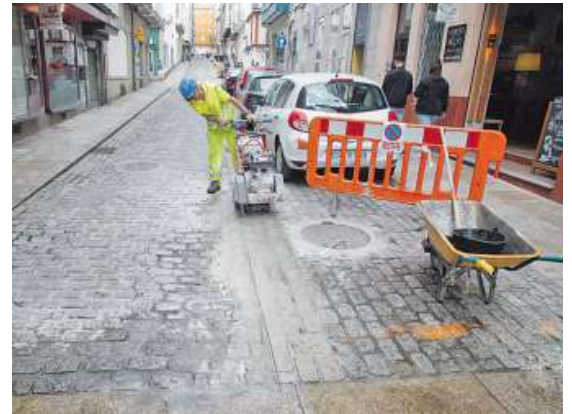
Las obras de sustitución del adoquín se iniciaron ayer. JOSÉ PARDO

rá a esta obra, que ejecuta la empresa Misturas, 58.000 euros. Es la misma firma que realiza la actuación en el Callao y la que tiene adjudicada el servicio de mantenimiento de viales en la ciudad.