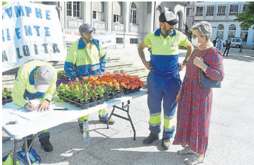
Una mujer espera a recoger una planta de las que regalaron los jardineros ferrolanos en su protesta

[PÁG. 7] Los trabajadores de los jardines de Ferrol protagonizaron en la plaza de Armas una protesta que consistió en una recogida de apoyos y un reparto de flor de temporada a los transeúntes. Una entrega de plantas con la que llamaron, además, la atención sobre el hecho de que en plena primavera no se haya procedido a plantar, por lo que optaron por este presente reivindicativo.