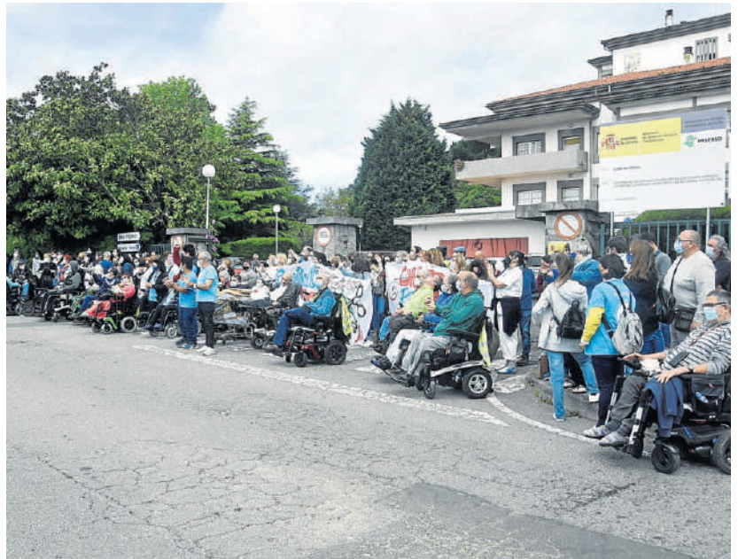
En la concentración participaron trabajadores, sindicatos y usuarios del centro

el que se puedan conocer las cualidades de cada uno. Degustaciones y talleres se sucederán en la feria, que hoy inaugura el alcalde, Ángel Mato, y la presidenta del Eixo Atlántico, Lara Méndez.