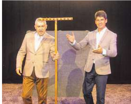
Talía presentará «A parábola do angazo».

No marco da mostra dedicada a Xosé Agrelo, os veciños de Muros terán unha nova cita co teatro o xoves. Neste caso será o grupo do centro ocupacional de Valadaredo que se suba ás táboas ás 12.00 horas para poñer en es-