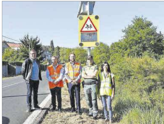
Nueva señal de seguridad vial en Pereiro.

Estas señales de tráfico están operativas desde ayer en los entornos escolares de los centros Bencho-Shey, en Pereiro de Aguiar, en la carretera OU-0508, y en el de los dos institutos de Xinzo de Limia, en la vía N-525. Cada señal dispone de sensores que detectan el paso de vehículos a motor y activan un mensaje de peligro con luces tipo led. Este aviso está en funcionamiento en los horarios de entrada y salida de los escolares, para mejorar la seguridad tanto del transporte escolar como de los vehículos particulares y los peatones. Estos dos centros escolares tienen varios centenares de alumnos y una alta