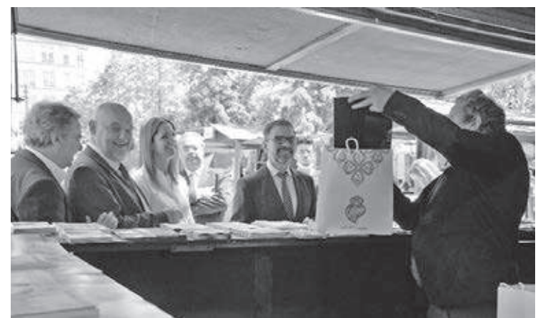
CM VIANA DO CASTELO

A Câmara Municipal de Viana do Castelo aproveitou esta 6.ª edição do Expocidades para dar a conhecer ao povo galego alguns dos seus pontos fortes do turismo gastronómico, tal como os doces de Xema e Mazapáns, as galletas de Viana e o vinho verde da sua própria região.