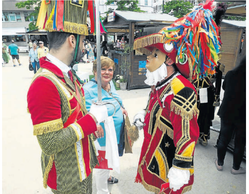
Una mujer contempla a un hombre vestido de forma tradicional frente a un maniquí en Expocidades

mantener la "estabilidad" con un gobierno asentado en la "moderación". También se dirigió a los gallegos, "libre de hipotecas", pero "cargado de deudas de gratitud": con su familia, con su partido y con los ciudadanos de la comunidad, con los aspira a seguir "avanzando juntos" por la senda de la "normalidad excepcional" que ve "bandera" de Galicia.