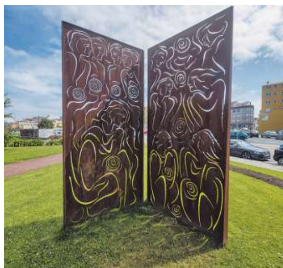
La escultura fue inaugurada el 26 de agosto del 2002. ANA GARCÍA

El pan se lleva a todas las ferias, «e sempre é moi ben valorado, dos mellor valorados nesas citas», señalan desde el gobierno local. Hace unos días se divulgó en Expocidades, como antes se hizo en Xantar, Fitur y muchos más. Es un regalo institucional en numerosas ocasiones, y acompaña, por ejemplo, la venta de libros en fechas señaladas. En Carballo Compromiso Calidade se creó la red de promoción con el sector turístico, primando que se use en sus menús. Todo ello suma para incrementar la reputación del producto y su visibilización.