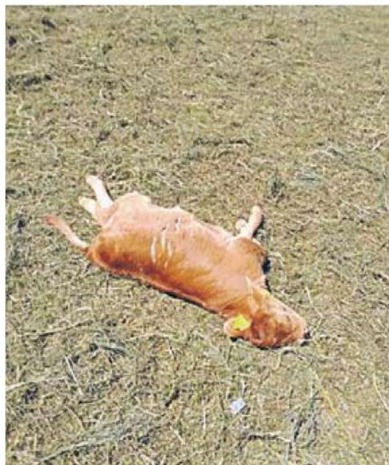
Una res atacada por el lobo en el Macizo Central.